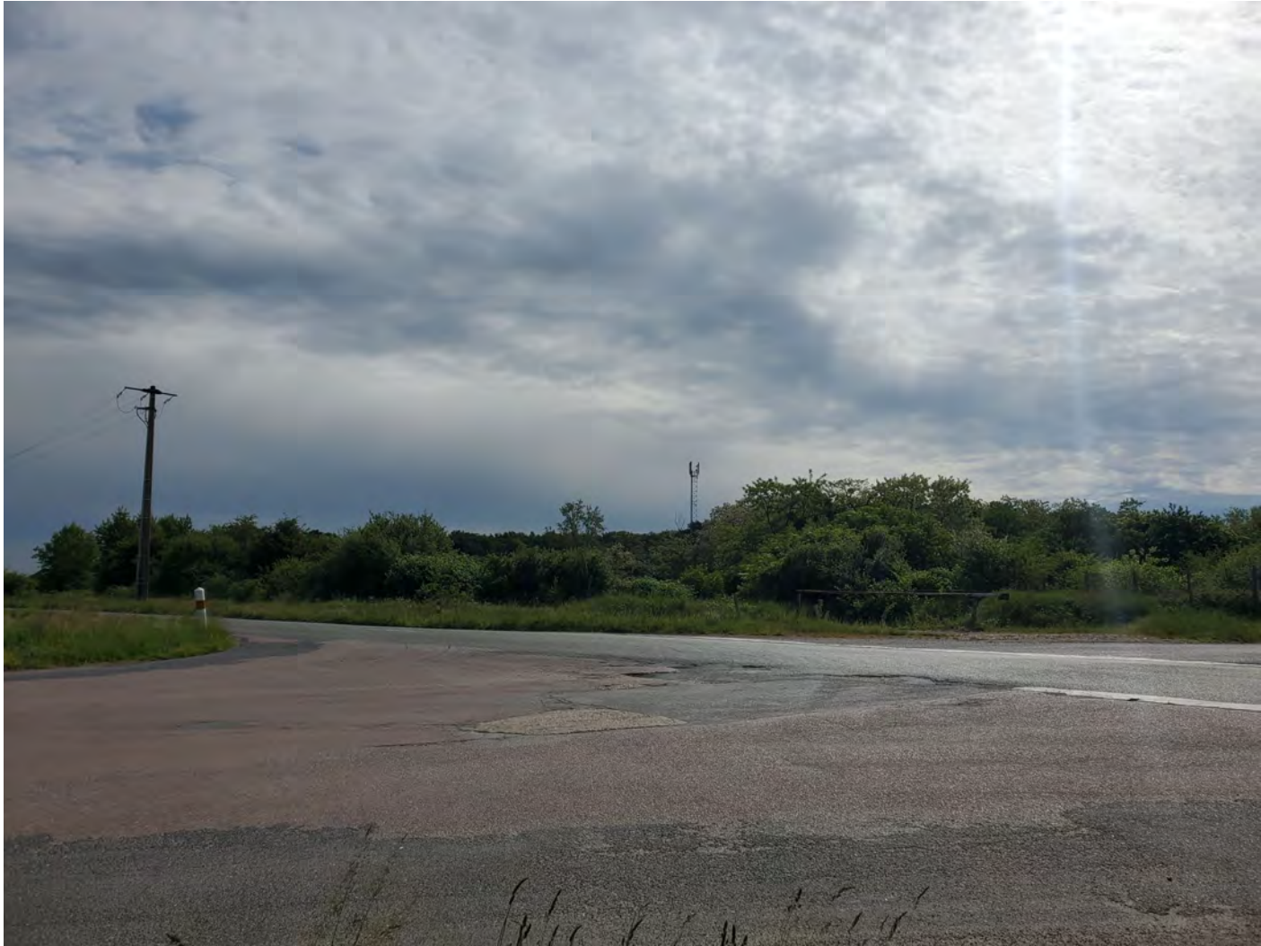
PDV 2 - Localisation du projet dans son environnement lointain