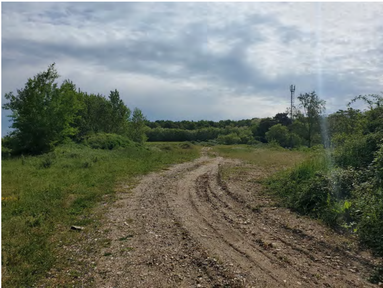
PDV 1 - Localisation du projet dans son environnement proche